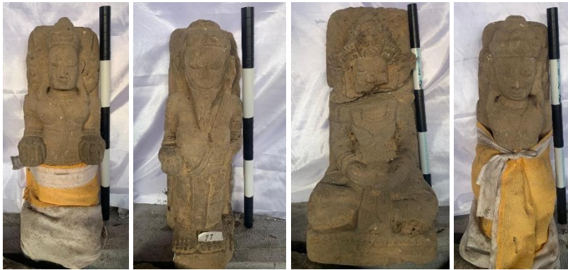
Gambar Arca Perwujudan I, II, III dan IV

perwujudan menggunakan kankana (gelang tangan) berbentuk lingkaran polos tanpa motif masing-masing berjumlah tiga buah. Terdapat 3 arca perwujudan menggunakan antarya bersusun tiga hingga kaki, yaitu Arca Perwujudan I, Arca Perwujudan II, Arca Perwujudan IV, dan 1 arca menggunakan antarya bersusun satu hingga lutut yaitu Arca Perwujudan III, Rata-rata motif kain yang digunakan pada arca-arca tersebut yaitu garis vertikal dan horizontal. Seluruh arca menggunakan sampur menjuntai di bagian kiri dan kanan dengan kain yang terurai lepas ke bawah dan simpul berbentuk bulat di bagian atasnya. Semua arca perwujudan menggunakan lapik dan stela .