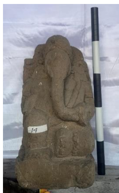
Gambar Arca Ganesha (Sumber: Dokumen Pribadi, 2024)

mahkotanya. Keempat tangannya menggunakan keyura (gelang lengan) tidak bermotif karena sudah aus dan kankana (gelang tangan) berbentuk lingkaran dengan motif untaian manik-manik polos. Katisura (ikat pinggang) berbentuk lingkaran polos tanpa motif. Padangada (Gelang kaki) yang digunakan bermotif untaian manik-manik polos. Antarya (kain bawah) tipis panjangnya sampai menutupi lutut polos tanpa motif. Sampur arca menjuntai di atas betis dengan ujung kain terurai lepas dan bermotif garis vertikal. Selain itu, kancut terjuntai hingga lapik . Stela berbentuk persegi empat dan oval pada bagian atasnya, dengan kondisi patah di sebelah kiri atas. Selanjutnya, arca digambarkan dalam posisi duduk di atas lapik berbentuk Padma .