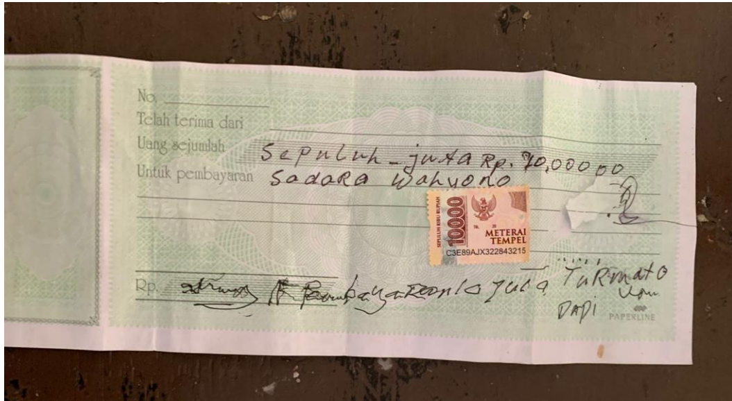
Gambar 2. Kwitansi Jual-beli rumah di Desa Gunungtiga

Kasus-kasus di atas menunjukkan pentingnya sosialisasi mengenai perancangan kontrak yang ditunjukkan untuk menghindari adanya kerugian hukum bagi masyarakat desa terutama pelaku usaha. Sosialisasi pada pengabdian masyarakat ini dilakukan dengan diawali pemaparan materi, lalu diskusi, dan tanya jawab yang ditunjukkan untuk memberikan pemahaman bagi masyarakat Desa Gunungtiga di Kabupaten Pematang, Kecamatan Belik agar dapat memperluas pangsa pasar dari segi jual-beli bagi pelaku usaha. Setelah pelaksanaan sosialisasi dan penyebaran pengetahuan mengenai praktik penyusunan kontrak bisnis, diharapkan masyarakat Desa Gunungtiga dapat memitigasi konsekuensi hukum yang terkait dengan kontrak yang masih dalam bentuk perjanjian lisan atau kontrak yang belum mencantumkan ketentuan-ketentuan esensial.