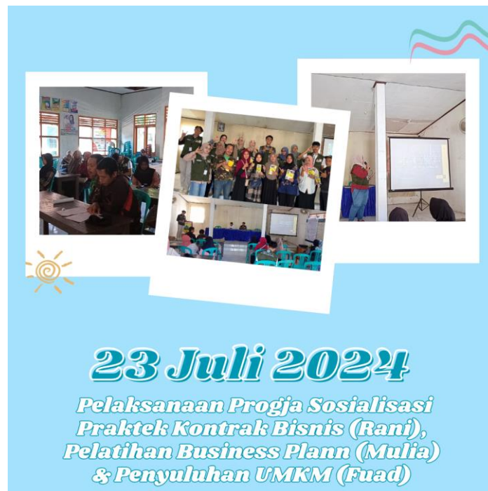
Gambar 3. Dokumentasi pada saat pelaksanaan sosialisasi