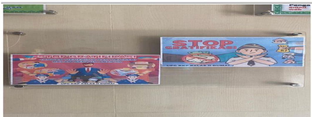
Gambar 4. Pelarangan Gratifikasi KKP Dumai