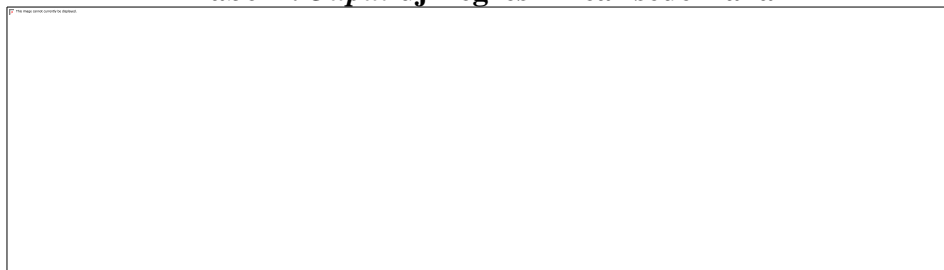
Tabel 1. Output uji regresi linear sederhana

Berdasarkan tabel output diatas ditemukan hasil persamaan regresi linear sederhana sebagai berikut: