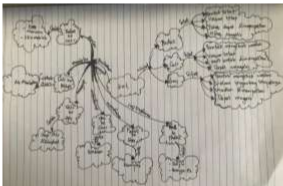
Gambar 1. Contoh mind mapping siswa

Dari gambar diatas dapat dilihat bahwa siswa tersebut dapat memahami konsep fisika mengenai wujud zat dan perubahannya dengan baik. Hal ini dapat dilihat dalam mind mapping yang dibuat siswa, tidak terdapat kesalahan konsep. Mind mapping yang dibuat oleh siswa sesuai dengan pemahaman siswa itu sendiri.