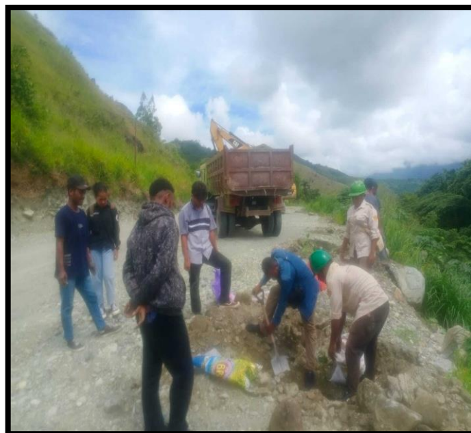
Gambar 2. Kegiatan Penggalian

Adapun kegiatan revegetasi, Revegetasi dimulai dengan dilakukan penanaman tanaman pionir seperti Seperti Ketapang, Jambu, Mangga, Sirsak, Nangka dan lainnya