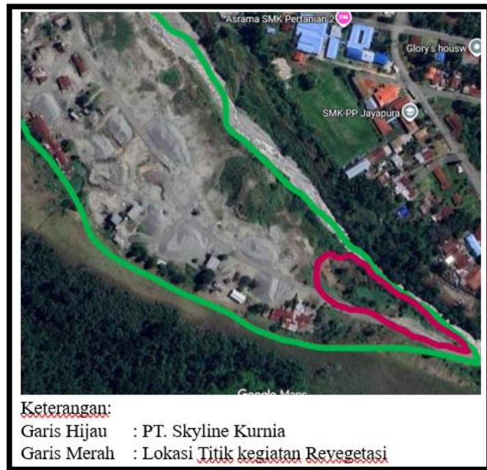
Gambar 2. Lokasi Revegetasi

Adapun kegiatan revegetasi, Revegetasi dimulai dengan dilakukan penanaman tanaman pionir seperti Seperti Ketapang, Jambu, Mangga, Sirsak, Nangka dan lainnya