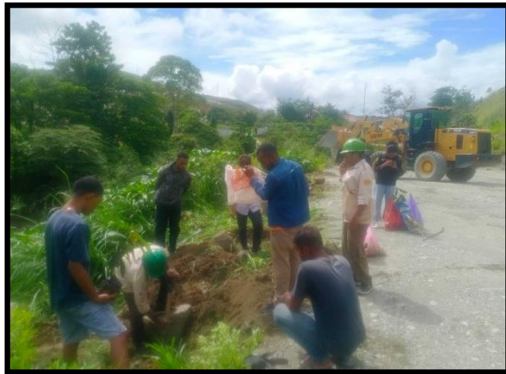
Gambar 3. Kegiatan Penggalian