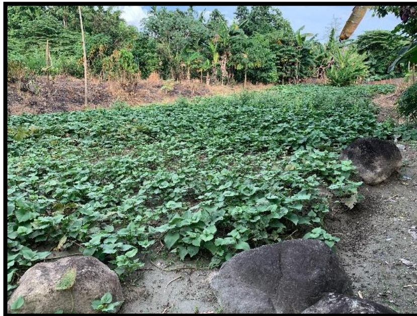
Gambar 5. Tanaman Penutup (Ubi Jalar)

Kegiatan reklamasi dengan menanam Ubi Jalar yang ditanam disekitar pinggiran sungai yang terdapat pada daerah penelitian, hal ini berfungsi untuk mencegah erosi dan pendangkalan pada sungai agar tidak terjadi sedimentasi.