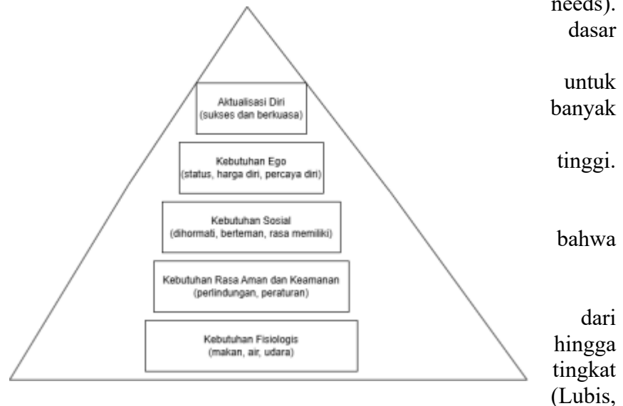
Gambar 2.1 Teori Hirarki Maslow

mempertahankan daya saing dengan orang lain. Demikian pula, kemarahan bisa terjadi agar seseorang merasa aman di lingkungan yang biasanya kurang mendukung. Secara umum, motivasi dapat dipahami sebagai dorongan untuk menggerakkan seseorang melakukan suatu tindakan (Cahyono et al., 2022). Teori humanistik yang dikembangkan oleh Maslow memiliki keunggulan, yakni dengan merancang teori hierarki kebutuhan (hierarchy of needs). Teori ini menjadi dasar dalam memahami motivasi manusia bertindak dan dipelajari di berbagai perguruan tinggi. Dalam teorinya, Maslow mengemukakan manusia memiliki beragam tingkatan kebutuhan, mulai dari kebutuhan dasar hingga kebutuhan yang paling tinggi (Lubis, 2019).