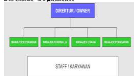
Gambar 2. Struktur Organisasi Perusahaan