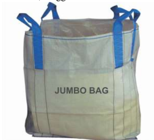
Gambar 3. Jumbo Bag

Karung jumbo ini terdiri dari bahan PP dengan benang yang memiliki deniar yang lebih tebal dan kuat. Sering juga ditambahkan inner plastic atau dilaminasi / coated, atau keduanya. Jumbo Bag dan Kapasitasnya, Design Karung Jumbo ini bermacam-macam sesuai dengan permintaan pelanggan, demikian juga kapasitasnya. Ada untuk kapasitas 300 Kg, 500 kg, 1 metrik ton, hingga 2 metrik ton. Design Karung Jumbo ini bermacam-macam sesuai dengan permintaan pelanggan, demikian juga kapasitasnya. Ada untuk kapasitas 300 Kg, 500 kg, 1 metrik ton, hingga 2 metrik ton.