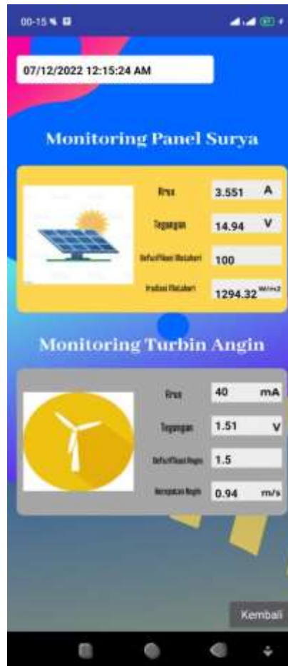
Gambar 2 Tampilan monitoring aplikasi yang terbaca sensor