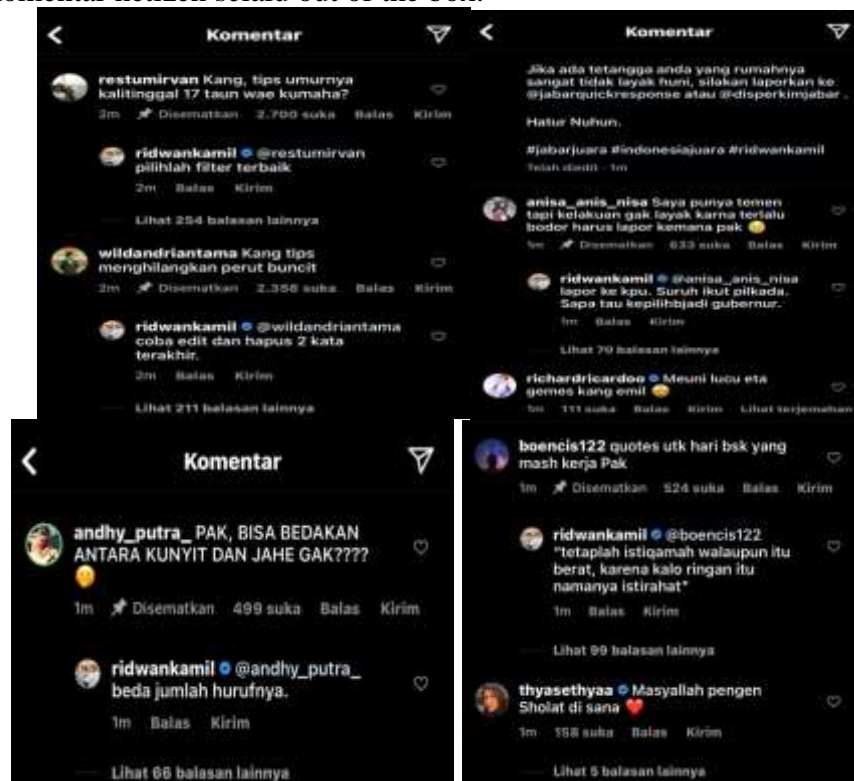
Gambar 3. Potret komunikasi Ridwan Kamil dalam Sosial Media Instagram

Dalam akun media sosial Ridwan Kamil, sebetulnya tidak banyak berbeda dengan akun-akun media sosial para figur pemimpin yang lain, diisi dengan video dan foto kerja-kerja pemerintahan. namun yang paling membedakan adalah, dalam setiap postingannya ia selalu menyematkan komentar netizen yang unik dengan jawaban yang lucu juga. Bahkan tak heran para followersnya selalu mengatakan “gabisa ditebak banget jawabannya”, karena jawaban-jawaban beliau terhadap komentar netizen selalu out of the box.