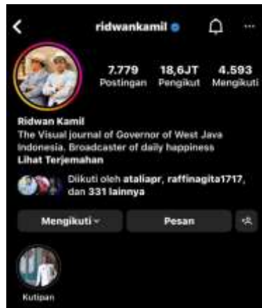
Gambar 1. Jumlah Followers Instagram Ridwan Kamil

Dari 49 juta masyarakat Jawa Barat, 70%nya atau sekitar 35 juta masyarakat Jawa Barat adalah pengguna internet, dan Jawa Barat merupakan provinsi dengan pengguna internet terbanyak di Indonesia. Artinya, 18,6 juta followers ridwan kamil setara dengan 50% pengguna internet Jawa Barat. Hal ini menjadi peluang tersendiri bagi Ridwan Kamil untuk terus menarik perhatian masyarakat dalam membangun citranya melalui media sosial, sebagaimana faktor-faktor dibawah ini :