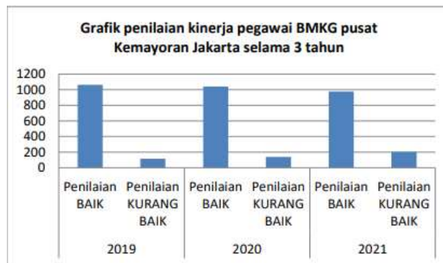
Gambar 1 Penilaian Kinerja

pemerintahan untuk memberikan pelayanan publik atau menjalankan kebijakan publik. Untuk mewujudkan sistem pemerintahan yang baik, berwibawa serta pelayanan publik yang efektif efisien perlu pengayoman profesionalitas dari Aparatur Sipil Negara di sistem pemerintahan yang diatur dalam peraturan BKN Nomor 8 tahun 2019. Sistem pengukuran ini diharapkan untuk menghasilkan kinerja yang baik.