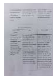
Gambar 7. Isi buku