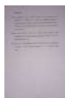
Gambar 8. Referensi