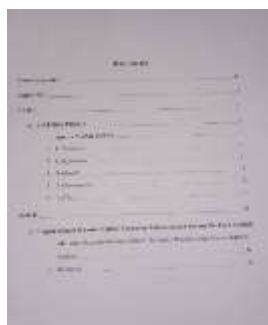
Gambar 3. Daftar Isi Handbook