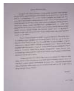
Gambar 4 Kata Pengantar