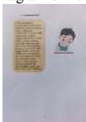
Gambar 5. Isi buku