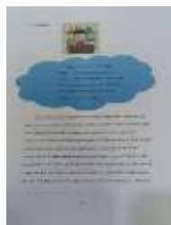
Gambar 6. Isi buku