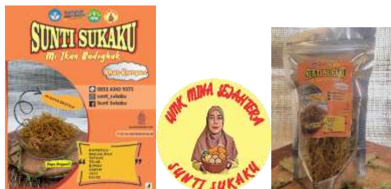
Gambar 1. Pengemasan dan pelabelan produk mi badoghak

Dalam pengemasan produk mi ikan badhogak menggunakan standing pouch aluminium foil pada kemasan baru, sehingga dapat menjaga kualitas produk lebih lama dan meningkatkan daya saing produk di pasaran baik itu di dalam maupun di luar daerah. Pada kemasan produk baru telah menggunakan foto produk mitra UMK Mina Sejahtera Sunti Sukaku sendiri, juga telah terlihat logo halal baru dan izin usaha P-IRT, nomor kontak yang bisa dihubungi juga telah ditulis, alamat untuk pemesanan online juga telah tersedia yakni menggunakan media sosial Facebook dan Instagram .