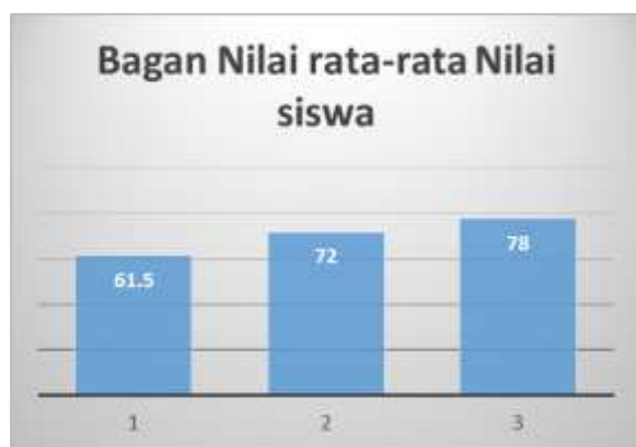
Gambar . 2, Bagan rata-rata nilai perlakuan PTK

Pada tahap pra penelitian nilai rerata siswa sebesar 61.5 dan pada tahap siklus 1 dan 2 sebesar, 72 dan 78.