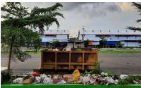
Gambar 3. Tumpukan Sampah di Sekitar Container

Dari hasil wawancara di atas dapat digarisbawahi bahwa problem persampahan di Morotai dan upaya penanganannya tidak sepenuhnya menjadi tanggungjawab pemerintah daerah (DLH Morotai) melainkan juga harus didukung dengan kesadaran masyarakat dalam hal pengelolaannya. Gambar di bawah ini menunjukkan minimnya kesadaran masyarakat Morotai khususnya pedagang di Sentral Belanja Daerah (CBD) Morotai/pasar baru.