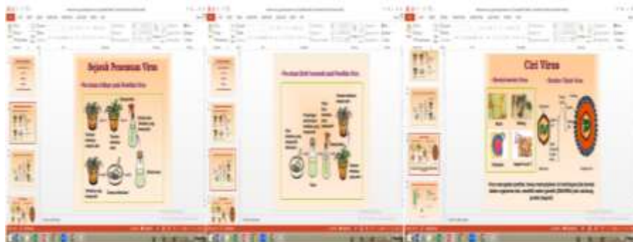
Gambar 1. Pembelajaran materi virus menggunakan media powerpoint (PPT)

Media pembelajaran powerpoint dapat menarik perhatian siswa untuk mengikuti pembelajaran yang sedang berlangsung dan memahami materi biologi yang disampaikan oleh guru. Hal ini sejalan dengan penjelasan Falahudin (2014) bahwa penggunaan media pembelajaran yang diajarkan guru di kelas dapat memberikan dampak psikologis bagi siswa, membangkitkan motivasi, dan merangsang kegiatan belajar dan dapat menimbulkan minat dan keinginan siswa. Efektivitas penggunaan media pada proses pembelajaran yang memuat pesan dan isi materi pelajaran yang disampaikan guru diawal kegiatan belajar mengajar akan sangat membantu siswa memahami poin-poin materi biologi yang diajarkan.