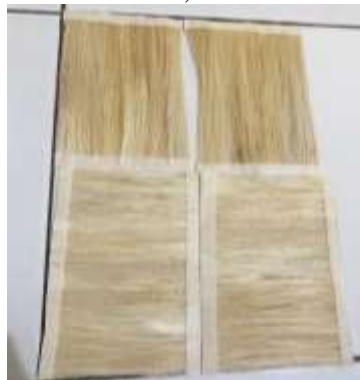
Gambar 5 Penyusunan Arah Serat

Selain perlakuan alkalisasi proses pembuatan komposit menggunakan variable variasi arah dengan variasi arah vertical, horizontal dan acak