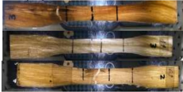
Gambar 8 Kepadatan Serat (a), 2 Jam (b), 4 Jam Serat (c), 6 Jam Serat

waktu alkalisasi 4 jam memiliki kepadatan serat kurang baik sehingga mempengaruhi nilai kuat tarik yang dihasilkan.