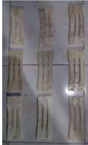
Gambar 6 Spesimen Uji Tarik

menggunakan resin polyester dan cetakan berukuran 20x15,5x0,5 dengan metode hand lay up.