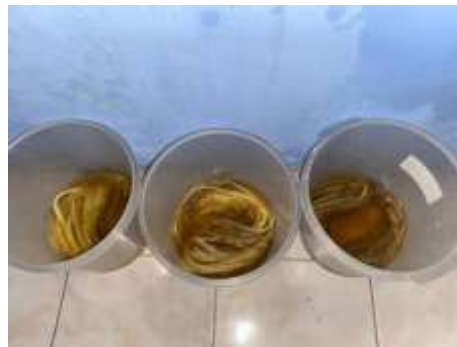
Gambar 4 Perlakuan Alkalisasi

Sebelum dilakukannya pembuatan specimen komposit dilakukan terlebih dahulu perlakuan alkalisasi terhadap serat agave dengan waktu perendaman 2 jam, jam dan 6 jam. Proses alkalisasi memiliki tujuan untuk menghilangkan beberapa komponen penyusun serat yang kurang baik dalam menentukan kekuatan antar serat pada komposit yaitu hemiselulosa, lignin, lilin dan pectin. Dengan berkurangnya komponen yang kurang baik didalam serat, wettability dan penyerapan matriks oleh serat akan semakin baik sehingga meningkatkan kekuatan material komposit.