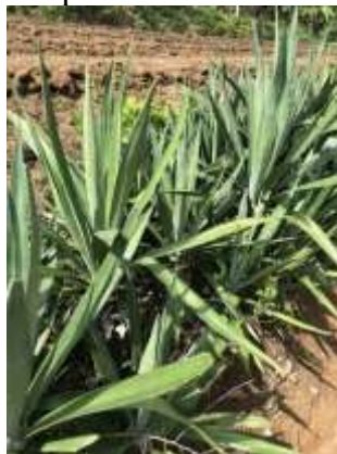
Gambar 1 Agave Sisalana

Komposit adalah jenis material yang ada saat ini bersama bahan lain seperti logam, polimer dan keramik. Material komposit adalah material multi-fase yang merupakan satu material campuran dua atau lebih jenis bahan, dengan ketika campurnya tidak ada reaksi kimia yang terjadi. sifat material komposit adalah kombinasi dari sifat-sifat komponen penyusunnya, yaitu matriks dan penguat (reinforcement) atau pengisi (filler). keduanya memiliki sifat yang berbeda. Kondisi Bahan: Penguat, harus dapat mendukung/meningkatkan sifat-sifat matriks bagian dalam membentuk material komposit.