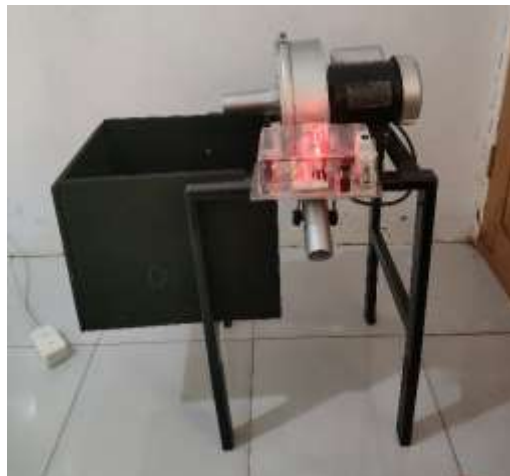
Gambar 2. Hasil akhir rancang bangun mesin pengisi bantal sebagai alat bantu produktivitas UMKM