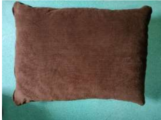
Gambar 4. Hasil bantal ukuran 60 cm x 50 cm diisi menggunakan mesin

Jadi, data yang didapat untuk kebutuhan produksi bantal dengan ukuran 60 cm x 50 cm diperoleh dengan waktu 2,31 menit/bantal (151 detik) dan dapat memproduksi 200 bantal/hari, 1.200 bantal/minggu, 5.200 bantal/bulan, 62.400 bantal/tahun dengan normal kerja 8 jam kerja.