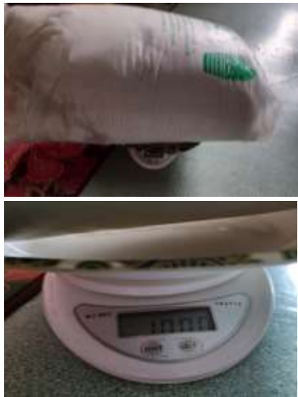
Gambar 5. 1 kg dakron silicon

Perhari = (\text{Produksi Bantal})/(\text{Dakron 1 kg}) = 200/3 = 66,66 \text{ kg/hari}