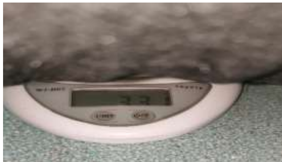
Gambar 6. Berat satuan bantal

Jadi, berat bantal ukuran 60 cm x 50 cm = 331 gram. Berarti jika waktu pengerjaan 200 bantal/hari maka hanya memerlukan Dakron Silicon 66,66 kg/hari, 400 kg/minggu, 1.733 kuintal/bulan, dan 20.800 kuintal/tahun dakron silicon untuk kebutuhan kerja.