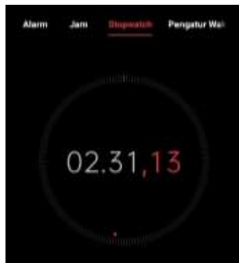
Gambar 3. Data pengujian menggunakan stopwatch

Kapasitas produksi bantal per menit = 2,31 menit/bantal (151 detik)