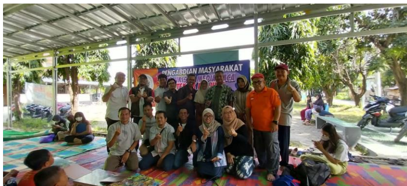
Gambar 6. Koordinasi di lokasi pelatihan sebelum kegiatan pelatihan