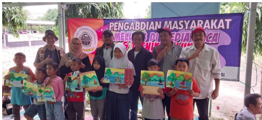
Gambar 8. Hasil Penilaian dan masukan pada peserta pelatihan