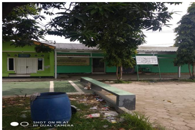
Gambar 1. Tempat penelitian kegiatan melukis cat air pada Perumahan Taman Alamanda Bekasi

Pada studi kasus kegiatan pelatihan melukis pada anak-anak menggunakan media melukis dengan kertas dan menggunakan cat air bertujuan wawasan serta menimbulkan kreativitas pada anak usia Sekolah Dasar maka pengabdian kepada masyarakat ini dilaksanakan di Kantor RW Perumahan Taman Alamanda Blok B RT.02/ RW.012, Desa. Karang Satria, Kecamatan. Tambun Utara, Kabupaten. Bekasi Kode Pos. 17568. Pengabdian kemasyarakatan Institut Sains dan Teknologi Al kamal ini juga merupakan pengabdian kemasyarakatan lintas prodi selain pelatihan melukis oleh prodi DKV dan juga prodi Teknik Kimia, Teknik Industri, Sistem Informatika dan Teknik Informatika melalui sosialisasi pengarahan bagi masyarakat dalam pembuatan sabun dan Sistem digital.