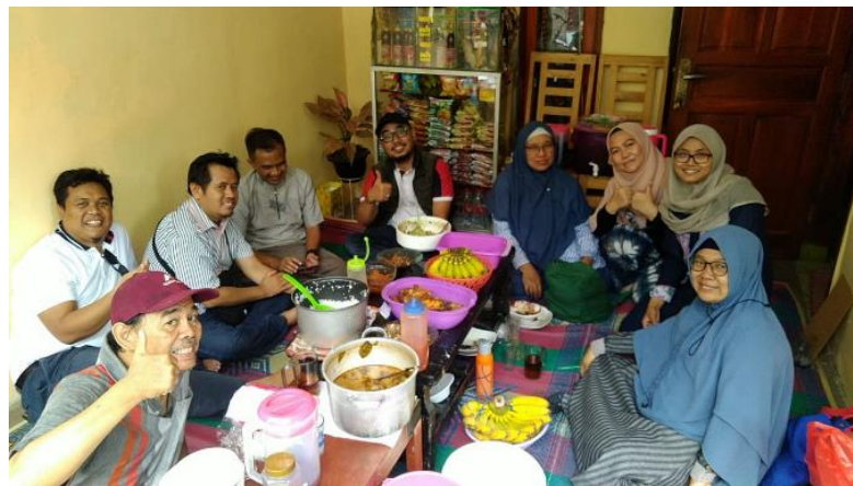
Gambar 5. Koordinasi di Lapangan sebelum kegiatan pelatihan