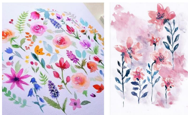
Gambar 11. Contoh Lukisan Teknik Cat Air Menggambar Jenis Bunga