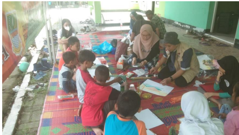
Gambar 7. Dokumentasi Pelatihan Melukis Cat Air