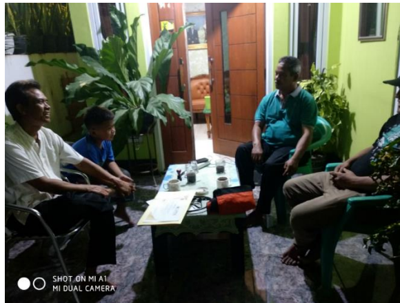
Gambar 4. Pertemuan dengan Aparat RT/RW Setempat