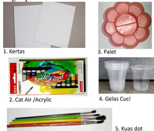
Gambar 2. Peralatan Menggambar/ Melukis dengan Cat Air