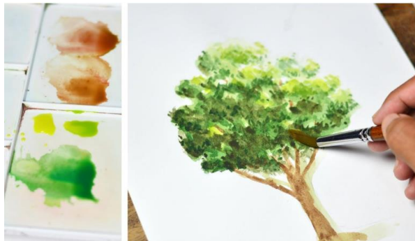
Gambar 10. Contoh Lukisan Teknik Cat Air Menggambar Pohon

Memberikan contoh kepada kepada anak-anak peserta pelatihan hasil-hasil dari karya lukis dengan menggunakan cat air didekatkan dengan tema pemandangan alam kultur di Indonesia seperti bunga-bunga, pepohonan, pegunungan dan lain-lain.