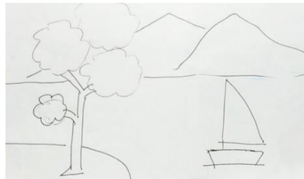
Gambar 12. Proses Kerja dalam melukis dengan cat air membuat sketsa dengan pensil

Membuat Sketsa dengan menggunakan pensil