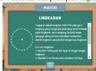
Gambar 6. Revisi Materi

3. Pemberian titik pusat pada lingkaran .