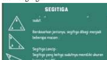
Gambar 33. Revisi

2. Pemberian penjelasan klasifikasi segitiga pada materi segitiga.