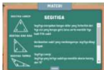
Gambar 4. Revisi Materi

2. Ditambahkan pengklasifikasian segitiga dan keterangan pada bangun segitiga.