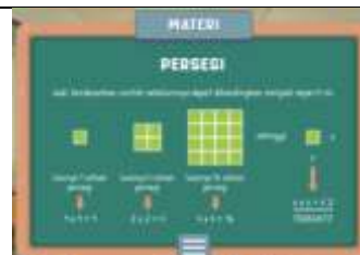
Gambar 2. Revisi Materi

2. Pemberian penjelasan klasifikasi segitiga pada materi segitiga.