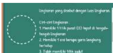
Gambar 5. Revisi Materi

3. Tidak adanya titik pusat pada lingkaran. Dengan garis putus-putus menimbulkan persepsi bahwa lingkaran memiliki banyak sisi.