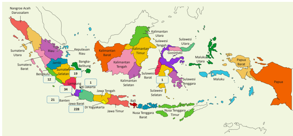
Gambar 2. Sebaran Kantor Perusahaan Modal Ventura di Wilayah Indonesia (Otoritas Jasa Keuangan, 2021)

Pertumbuhan jumlah pelaku usaha modal ventura syariah stagnan dalam 2 tahun terakhir ini. Namun demikian, industri ini mampu mencatatkan pertumbuhan aset sampai dengan Agustus 2021. Sampai dengan Agustus 2021, Otoritas Jasa Keuangan (OJK) mencatat pemain industri modal ventura syariah baru berjumlah enam pelaku usaha (Meilanova, 2021).