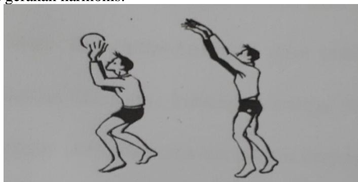
Gambar 2..Sikap Saat Perkenaan Bola Passing Bawa. Sumber :Suharno HP (1979: 17)

Sikap bola berhasil di passing maka lengan harus lurus sebagai suatu gerakan lanjutan diikuti dengan badan dan langkah kaki kedepan agar koordinasi tetap terjaga dengan baik. Gerakan tangan, pergelangan, lengandan kaki harus merupakan suatu gerakan harmonis.