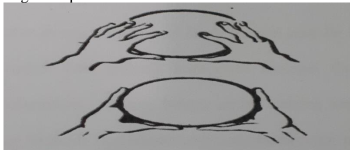
Gambar 1. Sikap Tangan Saat Perkenaan Bola Pada Saat Passing Bawa

Perkenaan bola pada jari adalah diruas pertama dan kedua terutama ruas pertama dari ibu jari. Pada saat jari disentuh pada bola maka jari-jari agak ditegangkan sedikit dan pada saat itu juga diikuti gerakan perselangan, lengan kearah depan atas agak eksplosif.