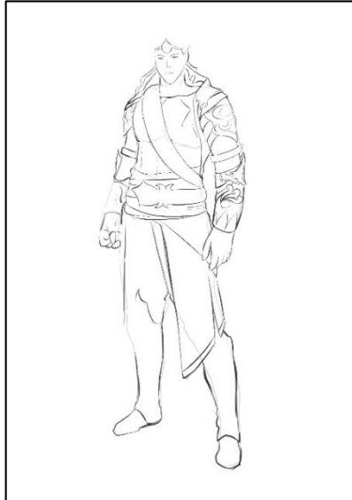
Gambar 3. Outlining Arjuna

art atau outlining. Sketsa ini sangat penting karena merupakan pondasi awal dalam membuat desain karakter, setelah sketsa dibuat selanjutnya melakukan proses line art atau outline, line art dapat dilakukan pada media digital menggunakan software ilustrasi, pain tool sai dipilih sebagai software utama karena mudah dalam mengorganisir layer, warna dan efek