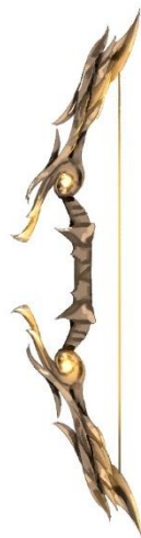
Gambar 6. Hasil final konsep senjata

Arjuna menggunakan senjata panah, Panas tersebut berwarna emas, dan pada peristiwa penting, panah tersebut bersinar terang