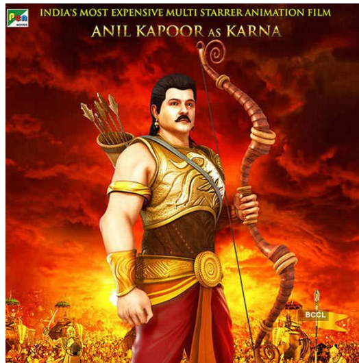
Gambar 1. Desain karakter arjuna pada animasi mahabharat 2013

besar. Berikut adalah gambar arjuna pada animasi mahabarata.