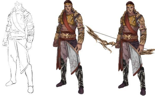
Gambar 7. Proses perancangan karakter

Konsep senjata tersebut ingin menggabungkan konsep sayap atau bulu dan juga pusaran matahari, bentuk panah mengambil bentuk budaya india dengan implementasi bentuk bulat dan lingkaran, pada saat yang sama juga mengimplementasi bentuk modern dengan bentuk yang tajam dan kaku