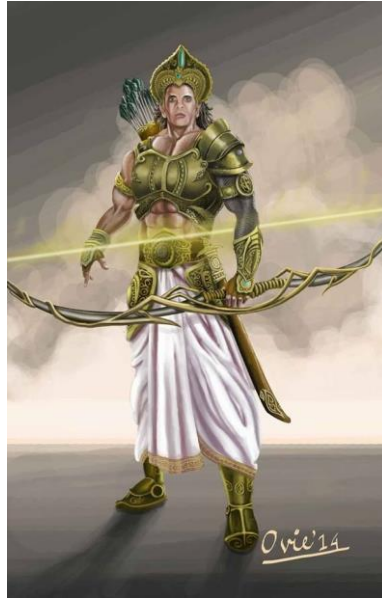
Gambar 2. Ilustrasi Arjuna (Sumber: Deviant art karya ZiaurOvi)

pengasingan di hutan selama bertahun-tahun karena konspirasi dan intrik yang dilancarkan oleh pihak Kaurawa, saudara sepupu mereka. Selama pengasingan tersebut, Arjuna mendapatkan berbagai pelatihan seni perang dan pengetahuan spiritual dari para dewa dan rishi.