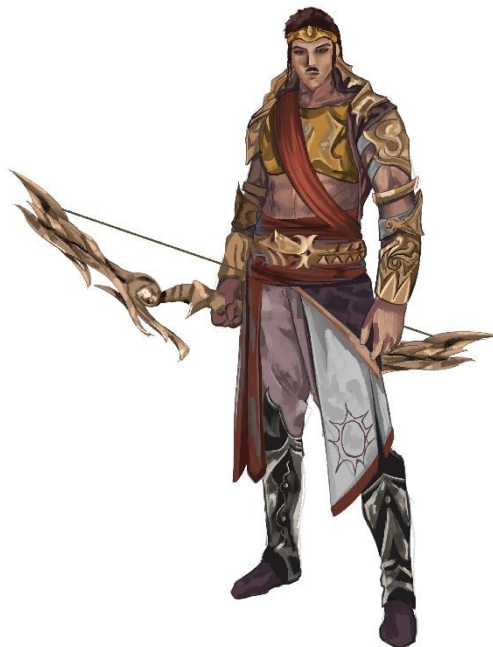
Gambar 8. Hasil final konsep karakter arjuna

Proses perancangan dimulai dengan pembuatan sketsa, setelah sketsa sebagai acuan awal selesai, kemudian pembuatan line art dan pewarnaan, hingga akhirnya penggabungan karakter aksesoris dan juga senjata