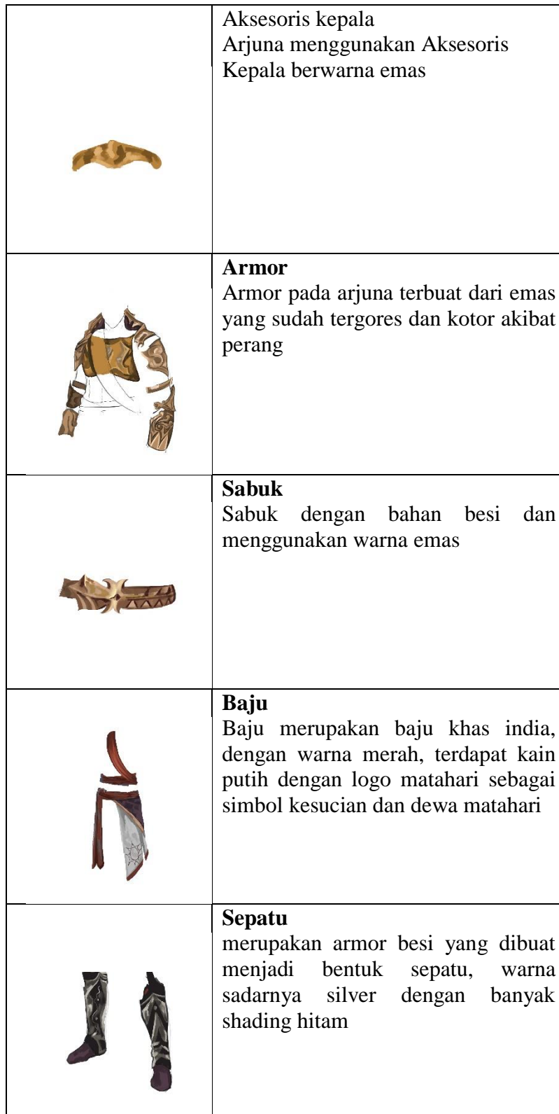
Tabel 1. Hasil perancangan