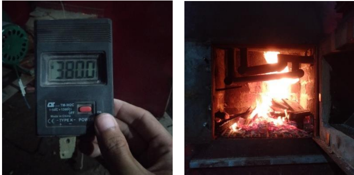
Gambar Uji Coba PLTSa