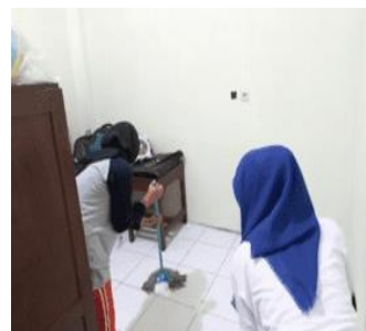
Gambar 6 Membersihkan

Ketiga , program “Go Pus (Go Perpustakaan)” dilakukan dengan open donation yang dilakukan dengan cara upload pamflet di Instagram Kampus Mengajar SDN 3 Karangrandu Jepara @km4_sdn3karangrandu dan menyebarkannya melalui akun media sosial masing-masing anggota tim Kampus Mengajar SDN 3 Karangrandu Jepara. Pada kegiatan open donation tidak hanya menerima bantuan berupa buku tapi juga barang dan uang. Buku dan barang donasi tidak harus baru. Barang lama yang layak pakai tetap diterima dengan baik.