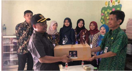
Gambar 7 Penyerahan Donasi Buku

Para donator tidak harus mengantarkan buku, barang, ataupun uang ke sekolah. Hal tersebut dapat dilakukan dengan penjemputan sesuai dengan lokasi yang telah disepakati. Jika donator bertempat tinggal dekat dengan rumah kepala sekolah ataupun para guru maka buku, barang, ataupun uang dapat dititipkan. Pemberian donasi berupa uang dapat dilakukan melalui Shoopepay. Banyaknya layanan yang diberikan pada open donation tentu untuk mempermudah masyarakat dalam berdonasi bagi perpustakaan SDN 3 Karangrandu Jepara.