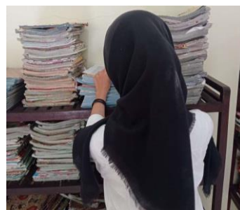
Gambar 2 Mengklasifikasikan