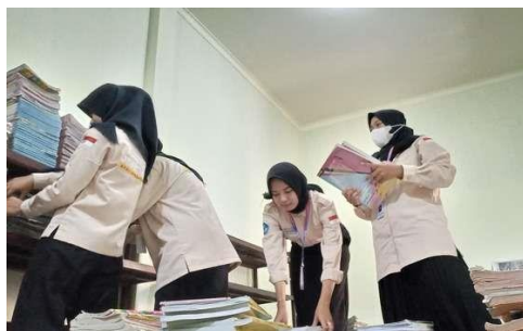
Gambar 5 Mengklasifikasikan Buku Perpustakaan

Kedua , mengklasifikasikan buku dan kebersihan. Mengklasifikasikan buku dilakukan setiap hari dengan tujuan agar mudah mencari buku untuk keperluan membaca dan menghindari hilangnya koleksi-koleksi buku perpustakaan. Tidak hanya mengklasifikasi namun juga membersihkan buku-buku tersebut agar terbebas dari debu. Dalam mengklasifikasikan buku tim Kampus Mengajar yang berjumlah 5 mahasiswa berbagi tugas. Hal ini dilakukan dengan tujuan agar cepat selesai. Terdapat dua mahasiswa yang bertugas untuk mengklasifikasikan buku, dua mahasiswa membersihkan buku, dan satu mahasiswa bertugas menata buku ke rak. Selain itu, untuk mewujudkan kenyamanan jika berada di perpustakaan dilakukan kegiatan bersih-bersih perpustakaan seperti membersihkan kaca, menyapu, mengepel, membersihkan, dan menata kembali barang-barang. Dalam hal menjaga kebersihan lingkungan perpustakaan juga dibantu oleh petugas kebersihan sekolah.