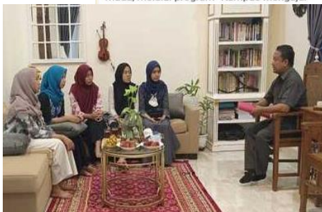
Gambar 9 Pemberitaan Koran Online