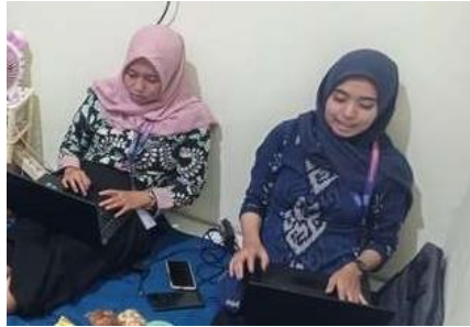
Gambar 8 Proses Pembuatan Administrasi Perpustakaan

Kelima , Kerjasama. Pada tahap perencanaan kerjasama dilakukan antara tim Kampus Mengajar dengan pihak sekolah maupun peserta didik saling berkolaborasi. Namun pada pelaksanaannya kerjasama juga dilakukan dengan pihak pemerintah Kabupaten Jepara yaitu Komisi C DPRD Jepara. Tim Kampus Mengajar SDN 3 Karangrandu Jepara mendapatkan bimbingan dari ketua Komisi C DPRD Jepara dan pihak pemerintah juga memberikan bantuan buku melalui program open donation . Selain itu, tim Kampus Mengajar SDN 3 Karangrandu melakukan kerjasama dengan 3 media koran online yang meliputi program "Go Pus (Go Perpustakaan)" yaitu Mahesa Media Canter, Media Suara Mabes, dan Jakarta Bicara. Kerjasama dengan media koran online merupakan hal yang tidak dipikirkan saat tahap perencanaan.