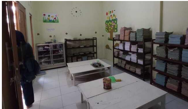
Gambar 4 Kondisi Perpustakaan

berbeda dengan desain pada tahap perencanaan. Besar atau kecilnya meja di perpustakaan tetap memiliki fungsi yang sama yaitu sebagai tempat untuk membaca.