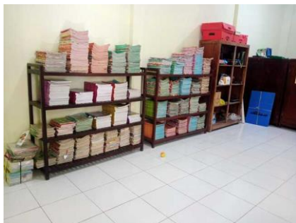
Gambar 1 Keadaan Awal Perpustakaan Buku

Tahap perencanaan berdasar pada hasil observasi dan wawancara terkait dengan kondisi perpustakaan. Hasil observasi yang dilakukan pada tanggal 1-7 Agustus 2022 mencatat bahwa SDN 3 Karangrandu Jepara memiliki perpustakaan namun koleksi buku yang dimiliki hanya buku paket pelajaran. Penataan buku tidak sesuai dengan judul. Selain itu, kata mutiara, buku presensi kunjungan, dan catatan peraturan tidak dapat dijumpai. Hal ini diperkuat dengan hasil wawancara dengan kepala sekolah dan para guru yang menyatakan bahwa perpustakaan SDN 3 Karangrandu Jepara adalah perpustakaan mandiri, dimana didirikan tanpa dana pemerintah dan tidak pernah menerima buku bacaan apapun kecuali buku paket pelajaran dari pemerintah. Peserta didik pada saat wawancara menyampaikan bahwa merasa tidak tertarik dengan perpustakaan karena hanya tersedia buku paket pelajaran dan suasana perpustakaan yang tidak nyaman. Peserta didik merasa tidak nyaman karena ruang perpustakaan banyak nyamuk, berdebu, dan tidak tersedia tempat atau meja untuk membaca.