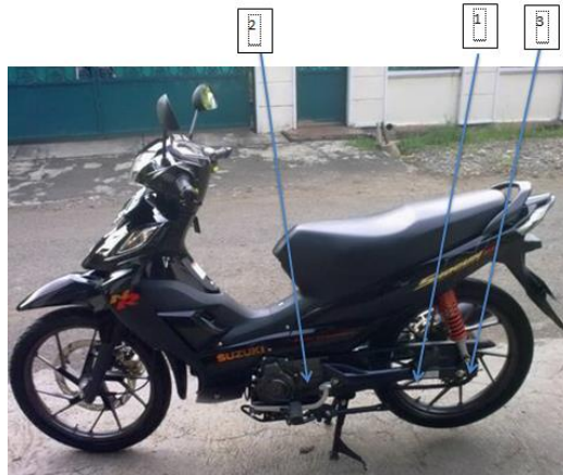
Gambar 2. Motor Suzuki Shogun FL 125 RCD.