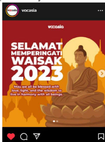
Gambar 8. Konten Feed Instagram @vocasia 22/06/23

Nilai sosial adalah nilai yang menggambarkan kebersamaan, kesetiakawanan, dan juga kepedulian antar sesama manusia. Pada Gambar 8 contoh konten instagram @vocasia dibawah berisikan nilai sosial seperti menghargai bagi umat beragama Budha dalam memperingati Hari Raya Waisak