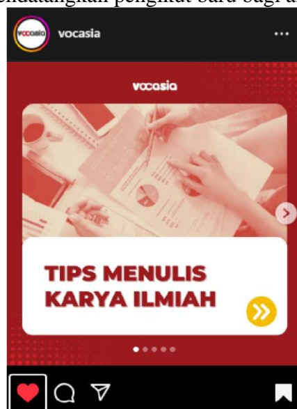
Gambar 2. Konten Feed Instagram @vocasia 22/06/23

konten tersebut dapat diharapkan bagi pengikut instagram @vocasia untuk mengetahui dan juga mendatangkan pengikut baru bagi akun instagram @vocasia.