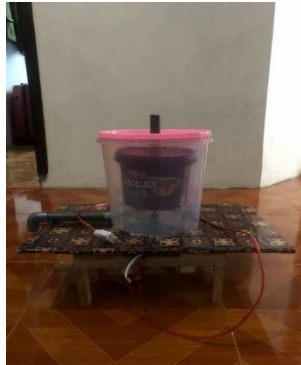
Gambar 2. Spinner Peniris Minyak

Teknologi tepat guna (TTG) merupakan suatu alat. Hal ini sering dikenal sebagai teknologi yang skalanya relatif kecil, hemat energi dan hemat biaya, serta erat kaitannya dengan kondisi setempat.. Teknologi tepat guna ini contohnya yaitu alat peniris minyak goreng yang terbuat dari dynamo kipas angin, penerapan teknologi tepat guna (TTG) ini perlu dilakukan sebagai solusi mengatasi permasalahan yang dihadapi oleh pelaku UMKM (Usaha Mikro, Kecil, dan Menengah). Alat peniris minyak spinner dipandang sangat tepat dan sangat dibutuhkan dalam mengatasi permasalahan pada UMKM Ngadiboyo, ketika memproduksi produk olahan bawang goreng kadar minyak yang berlebih pada saat setelah menggoreng. Hal tersebut dapat mengganggu proses pengemasan dari bawang goreng tersebut, dengan adanya alat peniris minyak goreng spinner yang dibuat diharapkan nantinya dapat membantu mengurangi kadar minyaknya.