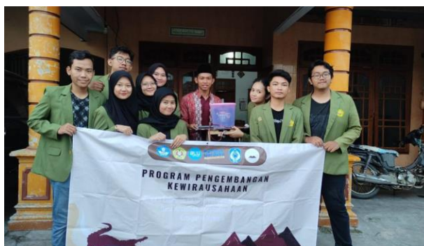
Gambar 3. Penyerahan Spinner Peniris Minyak kepada kepala dusun Ngadiboyo

Cara kerja dari alat peniris minyak goreng spinner ini adalah dengan meletakkan produk bawang goreng ke dalam toples kecil, lalu toples akan diputar oleh poros yang terhubung dengan dynamo kipas angin. Bawang goreng yang sudah dikeringkan berpindah ke sisi panci tetesan minyak karena gaya sentrifugal yang tercipta saat wadah diputar. sehingga minyak mengalir dari lubang kecil di sisi toples kecil dan jatuh ke dalam toples yang lebih besar. Selanjutnya minyak akan mengalir keluar dari toples besar melalui lubang yang telah dibuat pada bagian bawah toples besar menuju wadah penampung. Sehingga bawang goreng yang telah diletakkan pada dalam toples kecil menjadi kering.