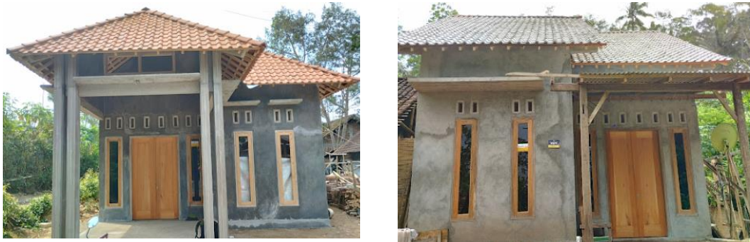
Gambar 3. Pasca Konstruksi Bangunan Program BSPS

Gambar diatas adalah dokumentasi dari program Bantuan Stimulan Perumahan Swadaya (BSPS) yang diterima oleh penerima bantuan di Desa Tempuran Kabupaten Ponorogo dengan jumlah bantuan sebesar Rp. 17.500.000,00 yang bersumber dari Anggaran Pendapatan Belanja Daerah (APPBD). Program BSPS ini sangat membantu warga desa Tempuran yang memiliki penghasilan rendah. Tidak hanya itu, warga menilai bahwa dengan adanya bantuan ini mampu dalam meningkatkan kesejahteraan dan menjaga kesehatan masyarakat. Salah seorang penerima bantuan di desa Tempuran Kabupaten Ponorogo mengaku sangat terbantu dengan adanya program ini. “Saya harap bedah rumah ini akan selalu diadakan karena bantuan dari pemerintah dapat membantu saya menjadikan rumah menjadi rumah layak huni” ujar Pak Seni selaku ketua Kelompok Penerima bantuan (KPB) saat di temui di tempat kediamannya.