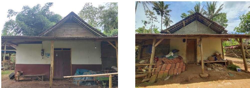
Gambar 2. Pra Konstruksi Bangunan Program BSPS

Rumah yang dapat dibangun dengan kekuatan pribadi pemilik rumah disebut dengan rumah swadaya. Rumah swadaya sendiri dimaknai dengan rumah yang diprakarsai oleh masyarakat. Rumah swadaya merupakan kumpulan dari rumah mandiri sebagai bagian dari rumah listrik perkotaan serta perdesaan yang diperuntukkan untuk masyarakat berpenghasilan rendah (MBR). Hal ini sesuai dengan Peraturan Menteri PUPR yakni PERMEN PUPR/7/PRT/M/2018. Dengan adanya program Bantuan Stimulan Perumahan Swadaya (BSPS) dapat meningkatkan kualitas hunian yang dimiliki masyarakat sehingga penerima bantuan yang memiliki rumah tidak layak huni dapat meningkatkan kualitas rumahnya menjadi rumah layak huni.