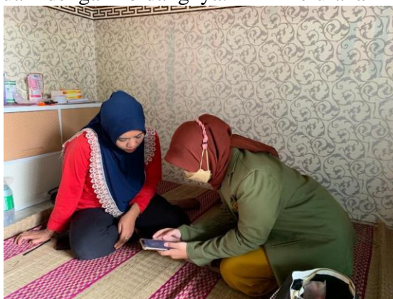
Gambar 1: Kegiatan Penulis melakukan sosialisasi kalimasada di RW03 Kelurahan Benowo

Di Kelurahan Benowo yang terdiri dari 6 RW dan 35 RT, program Kalimasada ini sangat membantu dalam pengurusan pelayanan adminduk. Masing-masing perwakilan RW tersebut nantinya disebut sebagai kader dan dibagi menjadi beberapa seksi sesuai dengan bidangnya. Di Kelurahan Benowo, program kalimasada ini disosialisasikan kepada perwakilan ketua RT dari RW. Namun masing-masing sosialisasi juga dapat dilakukan melalui online seperti Wa Group maupun Instagram.