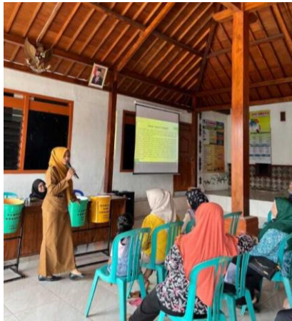
Gambar 2.6 Penyampaian Materi Oleh Pemateri