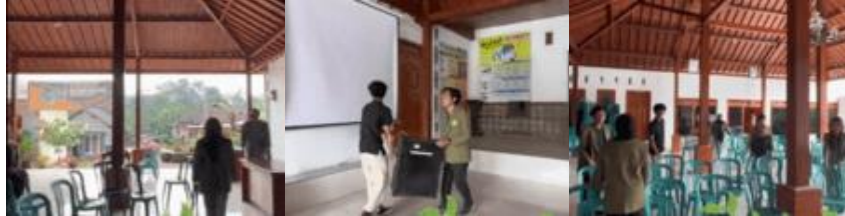
Gambar 2.3 Persiapan Acara Sosialisasi Bank Sampah

Pada tahapan ini, penulis beserta anggota kelompok 17 KKNT UPN Veteran Jawa Timur lainnya mempersiapkan keperluan alat dan bahan terkait keperluan sosialisasi. Alat dan bahan yang dimaksud dalam hal ini meliputi materi powerpoint yang akan disampaikan, koordinasi dengan pemateri, serta persiapan tempat, proyektor, mikrofon dan beragam keperluan lainnya.