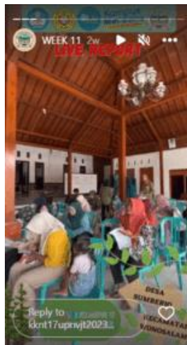
Gambar 2.1 Pengisian Kuisisioner Oleh Warga Desa Sumberjo Yang Hadir

Setelah kedua tahapan telah dilakukan, pada tahapan pengisian kuisisioner ini selanjutnya masyarakat diminta untuk mengisi kuisisioner yang telah disediakan kemudian bagi masyarakat yang telah mengisi kuisisioner diminta untuk mengumpulkan jawaban yang mereka berikan. Yang kemudian jawaban tersebut akan menjadi topik analisa dalam terlaksananya tujuan dari Sosialisasi Bank Sampah yang dilakukan.