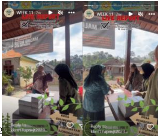
Gambar 2.4 Tahap Acara dan Penyampaian Materi (arga Desa Sumberjo)

Sejara setelah para tamu undangan hadir, acara segera dilaksanakan. setelah itu, acara diawali dengan sambutan dari Ketua Kelompok 17 KKNT UPN Veteran Jawa Timur lalu diteruskan dengan sambutan dari pihak pemerintah Desa Sumberjo.