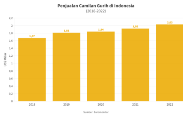
Gambar 3 Penjualan Camilan Gurih di Indonesia

Negara ketiga di duduki Argentina tahun 2020 sebesar 47.700, yang dimana dari ketiga negara tersebut sangat memiliki permintaan tinggi untuk konsumsi kedelai. Dibandingkan dengan Indonesia yang mengkonsumsi sebesar 3.133 ribu ton, bukan berarti Indonesia tidak gemar mengkonsumsi namun di negara lain juga memiliki diaspora yang mungkin gemar akan kedelai dan merindukan olahan kedelai dari Indonesia sehingga permintaan atau konsumsi di luar negeri lebih meningkat dibanding dalam negeri.