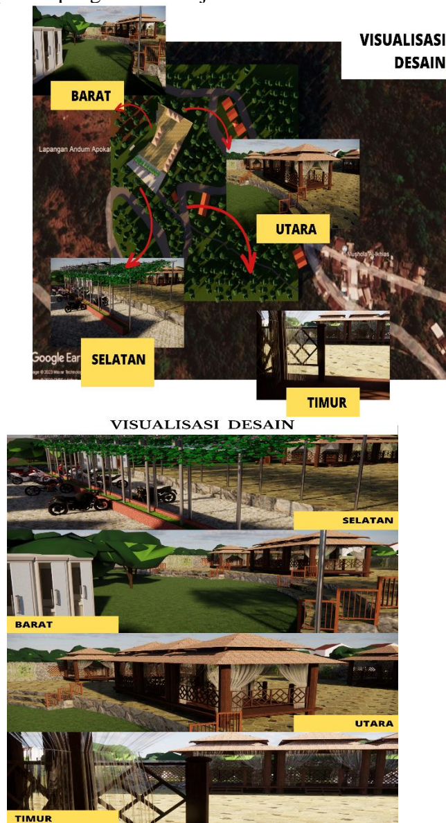
Gambar 3. Visualisasi Desain

lapangan yang telah dibangun mini garden atau taman mini, yang terakhir sisi barat merupakan lahan kosong yang sering dijadikan lokasi toilet sewaktu diadakan event-event tahunan pada lapangan Sambirejo ini.