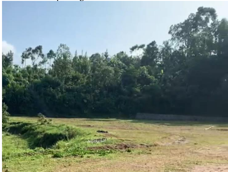
Gambar 1. Lahan lapangan desa Sambirejo

pengembangan potensi wisata. Perancangan ini sangatlah penting sebagai bentuk perencanaan dan prioritas program serta pengetahuan mengenai langkah dalam mendesain kawasan, pengelolaan potensi sumber daya desa, serta optimalisasi pemanfaatan lahan untuk kepentingan bersama.