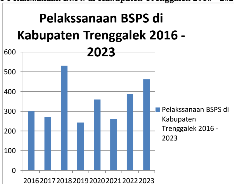
Table 1 Pelakssanaan BSPS di Kabupaten Trenggalek 2016 - 2023

Sumber : Koordinator Program Bantuan Stimulan Perumahan Swadaya (BSPS) Kabupaten Trenggalek