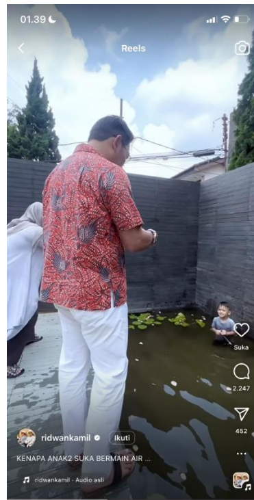
Gambar 2. Unggahan Ridwan Kamil di Media Sosial Instagramnya