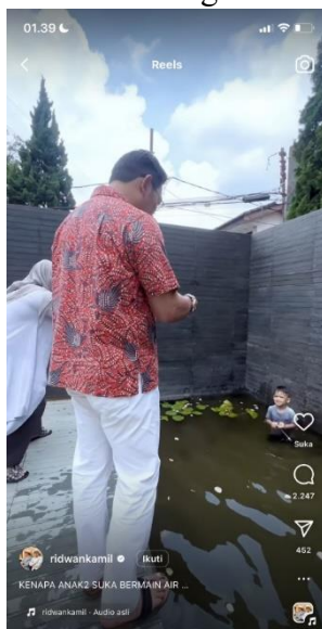
Gambar 3. Konten Objek Penelitian Berupa Video Kebersamaan Keluarga Ridwan Kamil

Penulis menghimpun data melalui konten yang diunggah Ridwan Kamil di media sosial Instagramnya. Adapun konten yang akan dianalisis merupakan konten reels di media sosial Ridwan Kamil sebagai berikut.