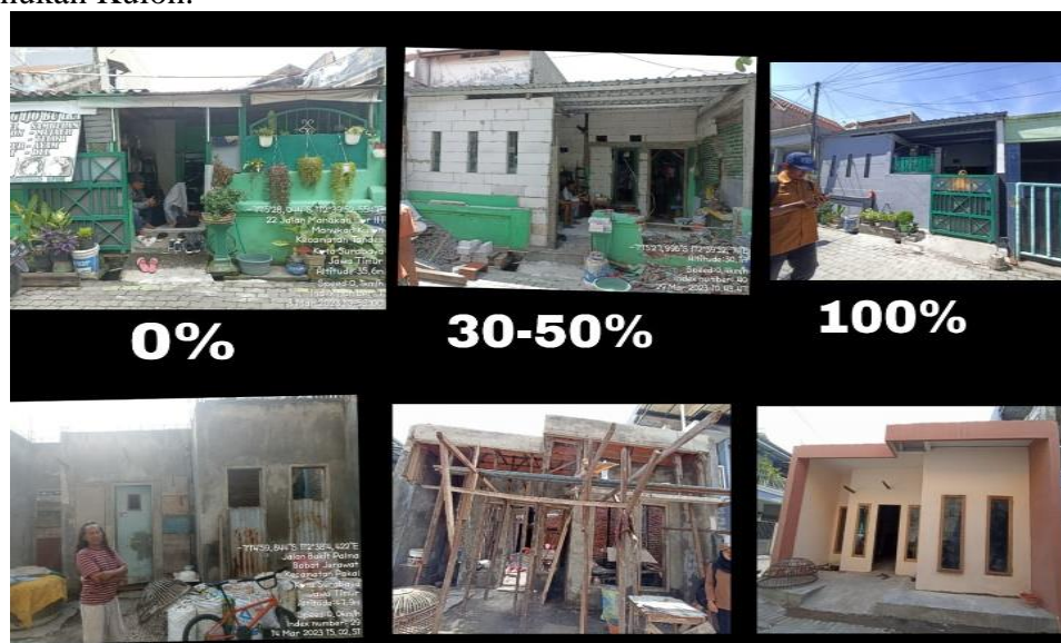
Gambar Perkembangan Rumah Penerima Bantuan

Kelurahan Tambaksari 65 Penerima Bantuan, dan Kelurahan Gayungan 60 Penerima Bantuan. Jadi total keseluruhan penerima Bantuan Stimulan Perumahan Swadaya (BSPS) di kota Surabaya adalah 276 Penerima bantuan. Salah satu penerima bantuan yang beralamatkan di Kelurahan Manukan Kulon yaitu Bapak Boy Jaya Asmara mengatakan jika bantuan ini sangat membantu keluarganya dalam mendapat rumah layak huni “Menurut saya BSPS ini sangat membantu bagi masyarakat berpenghasilan rendah seperti saya karena dengan program ini saya bisa memiliki rumah layak huni meskipun saya hanya berswadaya berdasarkan dengan uang yang saya miliki sekarang. Semoga Pemerintah terus menjalankan program BSPS ini karena dengan adanya program BSPS ini masyarakat seperti saya merasa terbantu” ujar Pak Boy saat ditemui di kediamannya yang berada di Kelurahan Manukan Kulon.