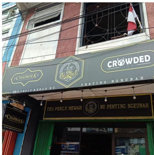
Gambar 6. Sebuah kafe bernama Chaproek di kawasan alun-alun

Usaha yang terdapat di Gambar 6 merupakan suatu kafe bernama 'Chaproek.' Menariknya, restoran ini memadukan tiga bahasa dalam papan tandanya. Nama tokonya berasal dari kosa kata bahasa Sunda, tapi pemilik toko mengubah cara penulisan leksikalnya menggunakan ejaan Bahasa Indonesia terdahulu. Dalam strategi pemasaran dan promosi, semakin unik nama suatu toko, maka semakin besar kemungkinan nama toko itu akan menempel di pikiran orang (Banda & Jimaima, 2015). Penulisan seperti ini memunculkan kesan trendi namun autentik yang dipadukan dengan jenis huruf modern. Lalu, penulisan tagline usaha tersebut merupakan kombinasi dari kosa kata Bahasa Indonesia dan Bahasa Sunda. Hal ini digunakan untuk memunculkan rima senada di tiap baitnya. Ukuran hurufnya pun berbeda dimana ukuran tulisan berbahasa Inggris lebih kecil dibandingkan tulisan Bahasa Indonesia dan Bahasa Sunda. Pilihan warnanya pun menarik karena papan tanda itu menggunakan kombinasi warna hitam, putih, dan emas dimana warna hitam dan emas bisa bermakna autentik atau tradisional. Dengan memadukan seluruh elemen yang ada dalam papan tanda toko, pemilik toko berhasil memadukan antara tradisional, sederhana, dan kekinian dimana penggunaan Bahasa Indonesia dan Bahasa Sunda memberikan nuansa lokal, sedangkan Bahasa Inggris memunculkan kesan global dan mengikuti tren perkembangan zaman.