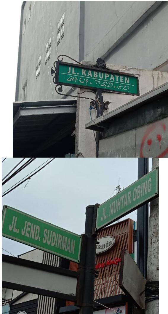
Gambar 3. Papan tanda nama jalan di kawasan alun-alun Kota Sukabumi

Contoh lainnya seperti pada Gambar 4, yaitu penggunaan Bahasa Sunda pada papan ajakan untuk membaca yang dikeluarkan oleh Kantor Perpustakaan Umum dan Arsip daerah Kota Sukabumi. Papan tanda ini menggunakan Bahasa Sunda yang terpampang jelas di posisi tengah papannya. Tulisan pada papan sedikit kabur, warna papan sudah memudar dan papan yang digunakan sudah penyok di bagian ujung papannya. Hal serupa pun terjadi pada poster yang lainnya dimana warna tulisan serta visual pada poster sudah lusuh dan pudar. Material yang digunakan untuk poster pun sudah rusak. Banyaknya papan tanda yang sudah usang dan tidak terawat ini bisa diinterpretasikan sebagai kurangnya perhatian Pemerintah Kota Sukabumi kepada papan tanda yang muncul di ruang publik.