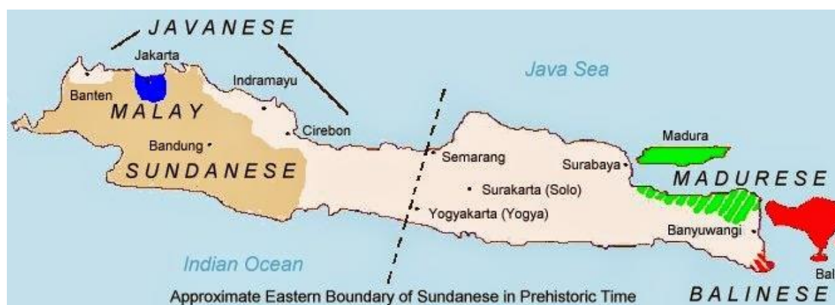
Gambar 1. Peta persebaran bahasa daerah di pulau Jawa

Walaupun pemerintahan Indonesia dengan giat mengusung penggunaan bahasa Indonesia, hal ini ternyata mengancam keberadaan bahasa daerah yang ada di Indonesia. Gambar 1 mengilustrasikan persebaran bahasa daerah di pulau Jawa, dimana terdapat lima bahasa yang masih dipakai oleh masyarakat pulau Jawa, yaitu bahasa Sunda, bahasa Melayu Betawi, bahasa Jawa, bahasa Madura, dan bahasa Bali.