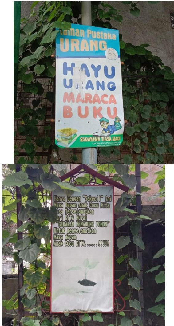
Gambar 4. Poster ajakan membaca buku dan ajakan menanam pohon Papan tanda pribadi

Papan tanda pribadi menunjukkan hasil yang cukup seimbang diantara pemakaian bahasanya dimana semua papan tanda yang ditemukan menggunakan pilihan bahasa antara Bahasa Indonesia, Bahasa Inggris, atau campuran keduanya. Penggunaan bahasa Inggris di papan tanda sektor usaha pribadi menunjukkan bahwa papan tanda pribadi tidak perlu terlalu kaku seperti papan tanda yang dikeluarkan oleh pemerintah. Mereka menggunakan bahasa secara kreatif untuk mengikat serta menarik minat konsumen. Terdapat beberapa usaha yang menggunakan multi bahasa pada papan tandanya seperti pada Gambar 6.