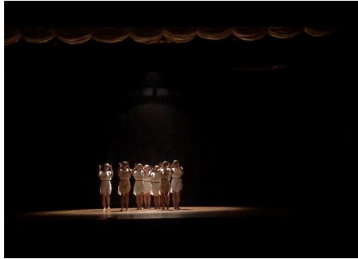
Gambar 2. Klimaks bagian 1 tari Aswamanu. Foto oleh Aneska, 2022.