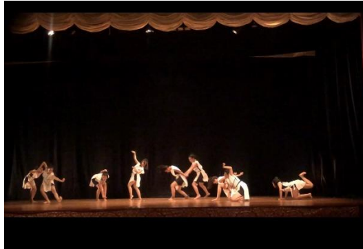
Gambar 4. Klimaks bagian 3 tari Aswamanu. Foto oleh Aneska, 2022.

Struktur ini nantinya akan mengalami perkembangan menyesuaikan dengan kebutuhan koreografi. Struktur karya tari ini membutuhkan tenaga dan kesiapan fisik yang kuat agar dapat menampilkan karya tari yang maksimal. Tenaga yang tersalur dengan baik di dalam tubuh mengakibatkan adanya nilai estetis yang terpancar, penyaluran itu disebabkan oleh penggunaan nafas yang teratur dan bermanfaat bagi ekspresi gerak (Swasti dalam Suteja, 2018: 90). Pengolahan nafas ini dikenal oleh masyarakat Bali dengan sebutan Ngunda Bayu . Ngunda Bayu sangat penting diterapkan pada penciptaan karya tari untuk mendukung dramatik karya.