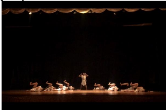
Gambar 3. Klimaks bagian 2 tari Aswamanu.

Adegan tengah yaitu penggambaran karakter manusia ketika memiliki insting yang kuat dalam melakukan pekerjaan. Menggambarkan usaha seorang manusia menjalankan kegiatannya dengan penuh semangat untuk mencapai tujuannya. Didalam adegan tengah ini, banyak memainkan pola gerak berpindah-pindah dengan tempo yang cepat untuk menghasilkan kesan cekatan. Selain memunculkan kesan cekatan, pencipta juga memunculkan kesan ambisi manusia dalam menjalankan pekerjaan.