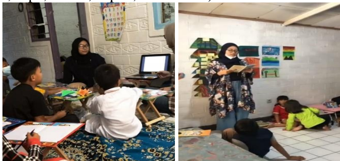
Gambar 2. Kegiatan-Kegiatan Pemberian Pendidikan Moral Melalui Program Belajar

Kegiatan peningkatan moralitas pada anak jalanan sendiri sudah terintegrasi dalam pelaksanaan program belajar kelompok bagi khusus seperti pemberian pendidikan karakter, pemberian pendidikan moral yang diintegrasikan dengan mata pelajaran yang lainnya, praktek dan pembimbingan secara langsung mengenai sikap-sikap baik seperti mengaji dan solat, serta melalui pembiasaan budaya 5S (senyum, sapa, salam, sopan, dan santun).