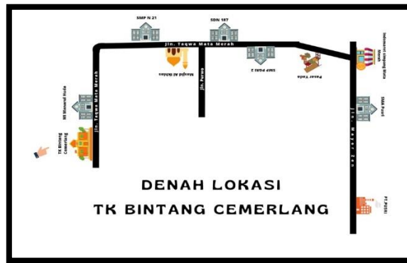
Gambar 1 Denah Lokasi TK Bintang Cemerlang