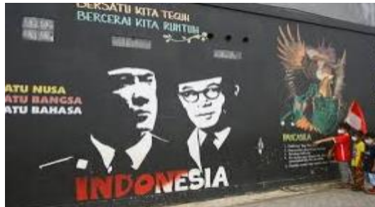
Gambar 3. Mural Pahlawan Kemerdekaan

Proses selanjutnya para siswa akan mengerjakan evaluasi secara tulis, dan para siswa mempunyai hasil dari penilaian tersebut.