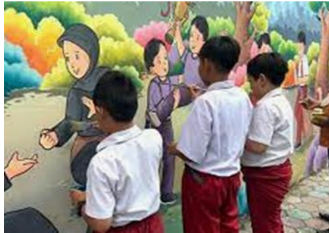
Gambar 1. Proses Membuat Mural

Proses ini membutuhkan waktu kurang lebih 3 hari untuk 1 gambar. Siswa mengerjakan secara berkelompok dibantu oleh guru kesenian. Anak mampu mengapresiasi gambar yang berhubungan dengan sejarah seperti foto pahlawan revolusi, pahlawan nasional dan beberapa gambar yang berhubungan dengan dengan sejarah nasional.