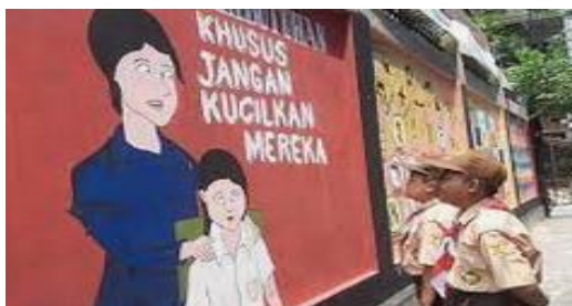
Gambar 4. Siswa SD sedang Mengamati Mural

Evaluasi akan diulang jika hasil rata-rata dibawah 60. Hasil ini menjadi refleksi pembelajaran sejarah. Para siswa mampu memberikan pendapat tentang gambar dan sejarah para pahlawan dengan baik. Pembelajaran ini mampu memberikan pembelajaran yang menarik dan atraktif.