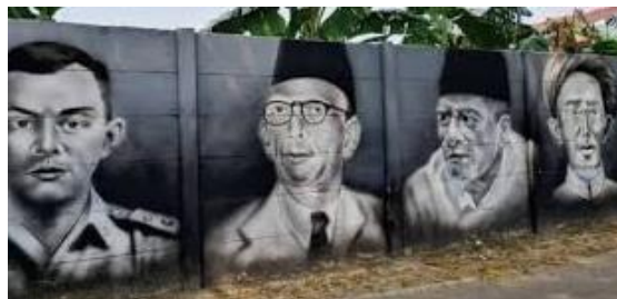
Gambar 2. Mural Pahlawan Revolusi dan Nasional Indonesia