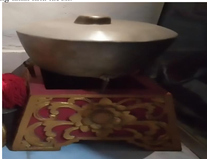
Gambar 18. Petuk

Petuk bentuknya kecil, terdiri dari 1 buah tetapi pengaruhnya sangat besar. Jika petuk tidak sejalan dengan irama gamelan, maka bisa membuat rusak nada pada gamelan yang akan kita tabuh.