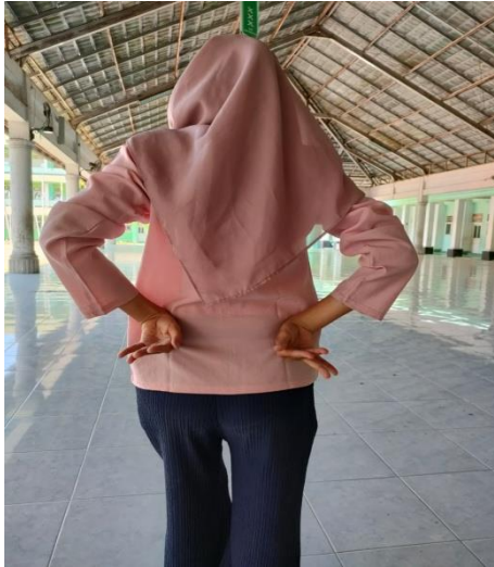
Gambar 2. Gerak tangan meber

Kedua tangan kiri kanan di samping, kemudian telapak tangan menghadap ke belakang. FOTO