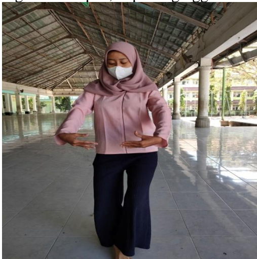
Gambar 3. Gerak tangan nyede

Kedua tangan dalam posisi ngebah , diayun ke depan dan ke belakang di depan badan yang dicondongkan ke depan, kepala nginggek dan tangan bergetar. FOTO