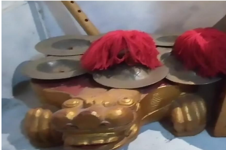
Gambar 17 Rincik