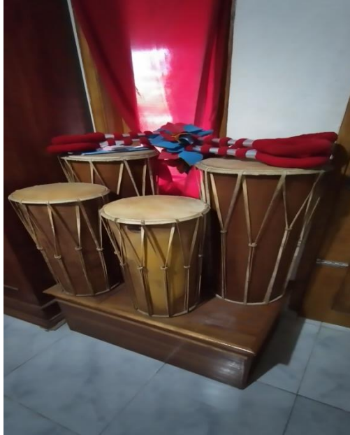
Gambar 16. Gendang lanag wadon

Gendang merupakan alat music yang terbuat dari kayu, kemudian ditutup dengan kulit hewan yang sudah kering. Gendang ini fungsinya sebagai moderator, dimana music akan dimulai dan dimana music akan berhenti.