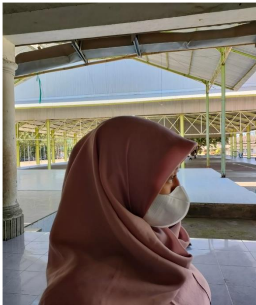
Gambar 5. Gerak kepala nyetuk ke belakang