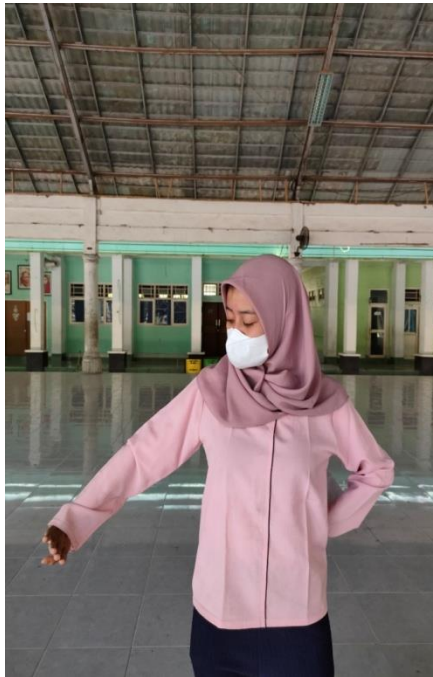
Gambar 6. Gerak tangan beseliwah