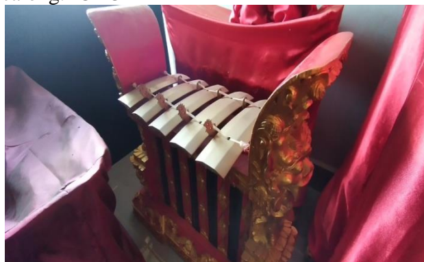
Gambar 13. Calong

Calong ini nadanya lebih rendah dari pemugah, jumlah calong yang digunakan adalah 5 buah calong.FOTO