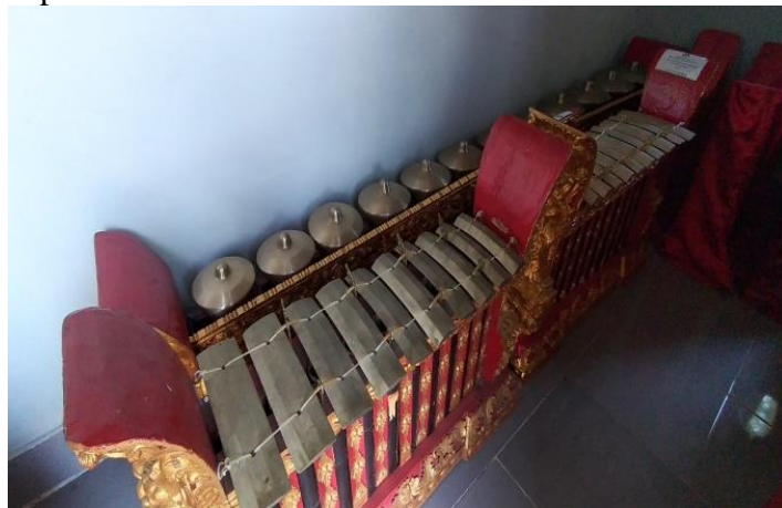
Gambar 11. Saron

Lebih kecil bentuknya dari pemugah, biasanya jumlah saron yang digunakan berjumlah empat buah saron. FOTO