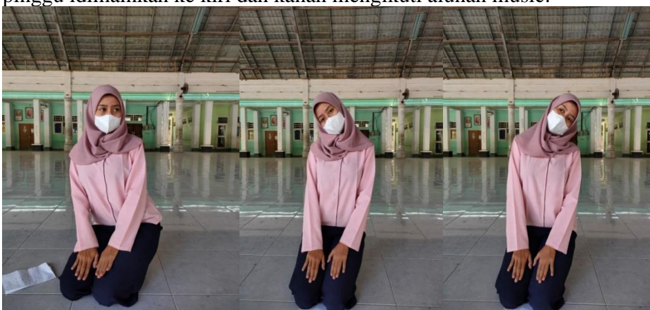
Gambar 9. Gerak Permainan

Gerakan tari pada saat babak permainan ini adalah gerak duduk saja. Dengan sedikit pinggu dimainkan ke kiri dan kanan mengikuti alunan music.