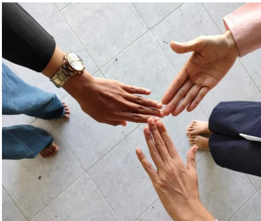
Gambar 7. Gerak tangan pemplang

Gerak tangan pemplang maksudnya tangan kanan di ayunkan ke kiri dan kanan dan biasanya di akhiri dengan tanda telapak tangan diatas atau punggung tangan yang diatas.