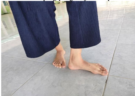
Gambar 1. Gerak kaki tapak seliwah

Dimulai dari sikap tapak tepah, kemudian salah satu tumit (kiri atau kanan) dipindahkan/diletakkan di samping pangkal jari telapak kaki yang lain.