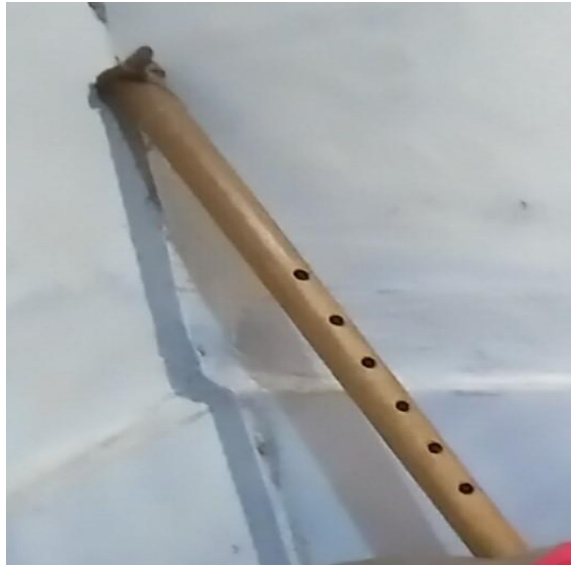
Gambar 19. Suling