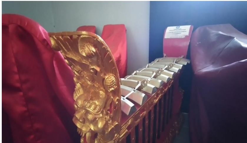
Gambar 12. Kantil