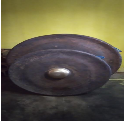
Gambar 15. Gong Nine-Mame

Merupakan alat music gamelan yang terbuat dari besi berbentuk bulat, dengan benjolan ditengahnya sebagai tempat memukul