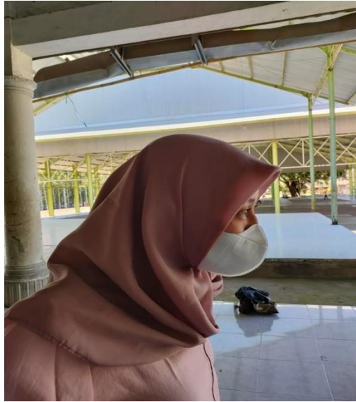
Gambar 4. Gerak kepala nyetuk ke depan