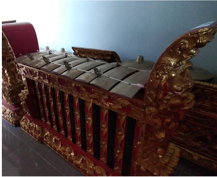
Gambar 10. Pemugah