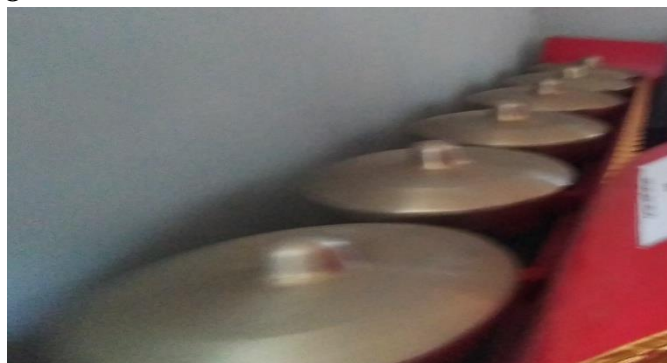
Gambar 14. Barangan

Bentuknya bulat kecil seperti gong,alat music ini biasanya 12 nada yang dipakai.FOTO