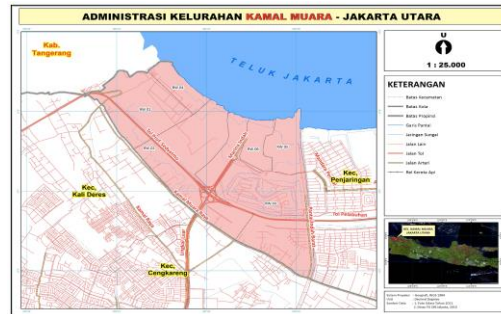
Gambar 1. Peta Administrasi Kelurahan Kamal Muara Jakarta Utara

Kamal Muara berasal dari kondisi lingkungan sekitar sungai yang mengalir ke Laut Jawa.