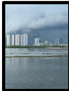
Gambar 3. Perbatasan antar Kamal Muara dan Pantai Indah Kapuk (PIK)