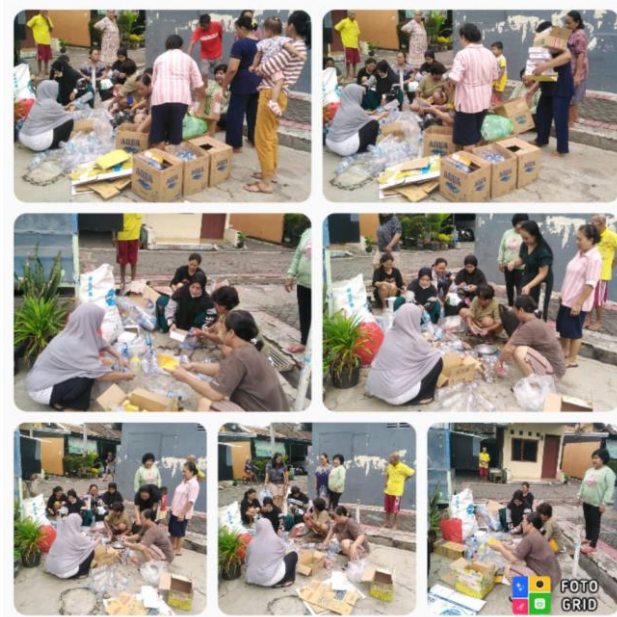
Gambar 2. Kegiatan pilah sampah

Tingkat partisipasi longwe diartikan sebagai kesetaraan partisipasi perempuan dalam proses pengambilan keputusan, pembuatan kebijakan, perencanaan, dan administrasi. Pada pembangunan partisipasi perempuan sangat penting untuk dilibatkan dalam pengambilan keputusan terlebih yang berpengaruh terhadap komunitas mereka (March et al., 1999). Partisipasi perempuan berperan penting dalam pembangunan masyarakat, hal tersebut karena dengan adanya partisipasi perempuan didapatkan informasi mengenai kondisi, kebutuhan serta sikap masyarakat. Perempuan juga lebih dapat dipercaya dan bertanggung jawab jika terlibat dalam suatu kegiatan mulai dari perencanaan hingga memanfaatkan hasil program (Purnamawati & Utama, 2019).