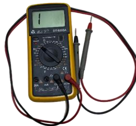
Gambar 2. Multimeter

adalah alat ukur dasar yang umumnya digunakan oleh para teknisi, praktisi, dan bahkan individu yang tidak memiliki latar belakang teknis di rumah [8].