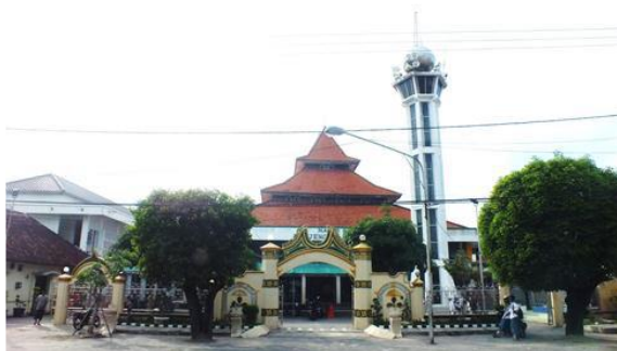
Gambar (2) Masjid Besar Kanjeng Sepuh Sidayu