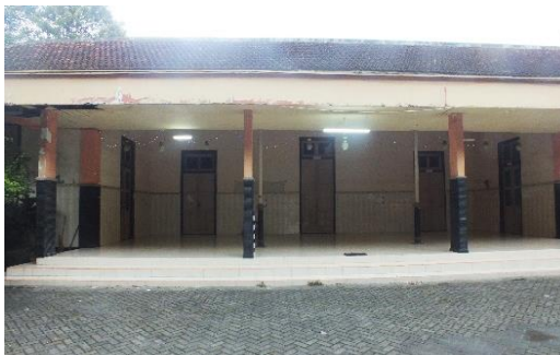
Gambar (4) Kantor Kawedanan Tampak Depan