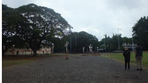
Gambar (1) Alun-alun Sidayu (kiri) dan