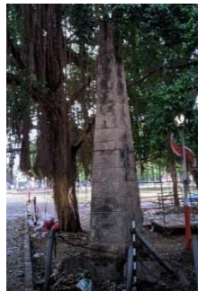
Tugu Alun-alun Sidayu (kanan)