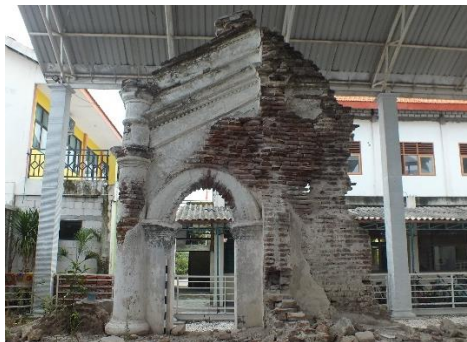
Gambar (5) Sisa Reruntuhan Pasujudan