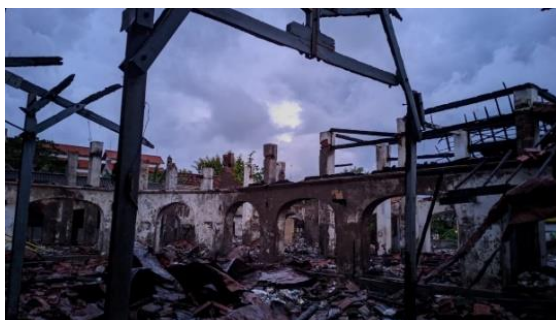
Gambar (3) Pasar Sidayu