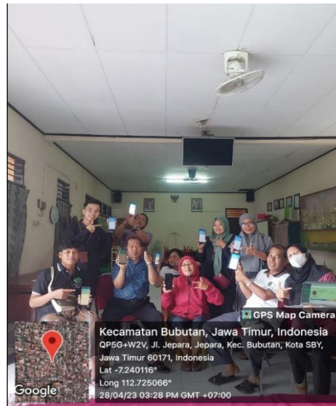
Gambar 4. 1 Pelaksanaan Sosialisasi dan Aktivasi IKD di Balai RW Kelurahan Jepara Kota Surabaya