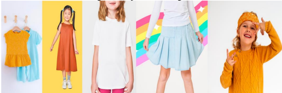
Gambar 5. Pakaian anak perempuan yang memiliki hubungan paradigmatik dengan jubah.