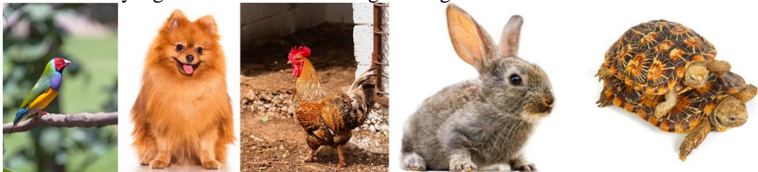
Gambar 7. Hewan peliharaan yang memiliki hubungan paradigmatik dengan kucing.