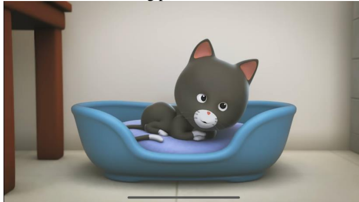
Gambar 6. Karakter Antta