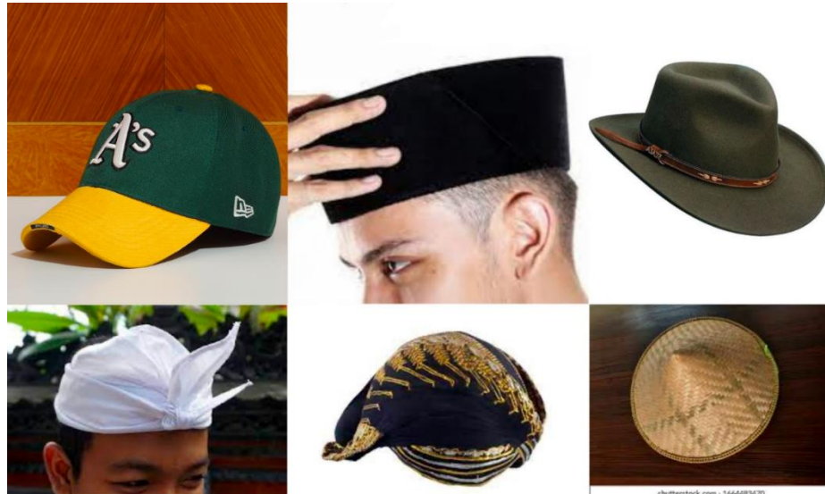
Gambar 2. Penutup kepala yang mempunyai hubungan paradigmatik dengan peci.