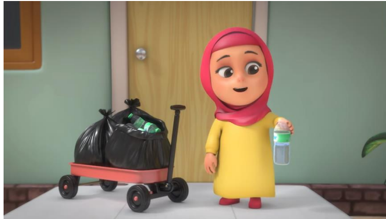
Gambar 4. Karakter Rara