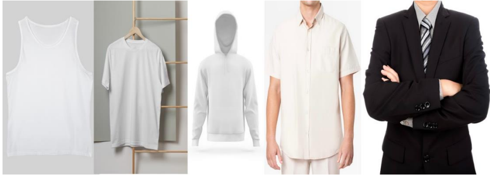
Gambar 3. Pakaian yang mempunyai hubungan paradigmatik dengan gamis Sumber : freepik

Gamis memiliki hubungan paradigmatik dengan pakaian lainnya seperti singlet, kaos, hoodie, kemeja, dan jas. Nussa tidak mengenakan pakaian lain yang disebutkan karena gamis adalah pakaian yang paling cocok untuk memberikan kesan Islami tersebut.