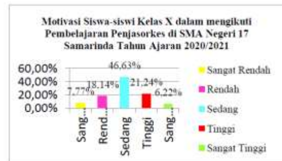
Gambar 1. motivasi siswa-siswi kelas X

Berdasarkan tabel dan gambar di atas menunjukkan bahwa motivasi siswa-siswi kelas X dalam mengikuti pembelajaran penjasorkes di SMA Negeri 17 Samarinda tahun ajaran 2020/2021 berdasarkan indikator psikologi dalam faktor intrinsik berada pada kategori “sangat rendah” sebesar 7,77% (15 siswa/i), “rendah” sebesar 16,59% (32 siswa/i), “sedang” sebesar 40,41% (78 siswa/i), “tinggi” sebesar 31,61% (61 siswa/i), dan “sangat tinggi” sebesar 3,62% (7 siswa/i). Berdasarkan nilai rata-rata, yaitu 15,79 motivasi siswa kelas X dalam mengikuti pembelajaran Penjasorkes di SMA Negeri 17 Samarinda Tahun Ajaran 2020/2021