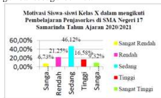
Gambar 3. Motivasi siswa kelas X

Berdasarkan distribusi frekuensi pada tabel tersebut di atas, motivasi siswa-siswi kelas X dalam mengikuti pembelajaran penjasorkes di SMK Negeri 17 Samarinda tahun ajaran 2018/2019 dari data motivasi dengan faktor ekstrinsik yang telah diperoleh peneliti dan disajikan pada gambar sebagai berikut: