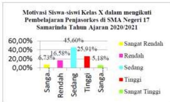
Gambar 2. Motivasi siswa kelas X

berdasarkan indikator psikologi pada faktor intrinsik dalam kategori “sedang”. Distribusi frekuensi data hasil penelitian tentang motivasi siswa-siswi kelas X dalam mengikuti pembelajaran penjasorkes di SMA Negeri 17 Samarinda tahun ajaran 2020/2021 berdasarkan indikator bakat dalam faktor intrinsik didapat skor terendah ( minimum ) 4, skor tertinggi ( maksimum ) 16, rata-rata ( mean ) 11,71, nilai tengah ( median ) 12,00, nilai yang sering muncul ( mode ) 12, dan standar deviasi (SD) 2,34.