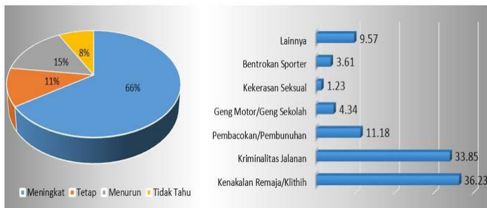
Gambar 1.1 Data Statistik Jumlah kekerasan di Indonesia

Usia remaja adalah masa transisi seseorang dari masa kanak-kanak menuju masa