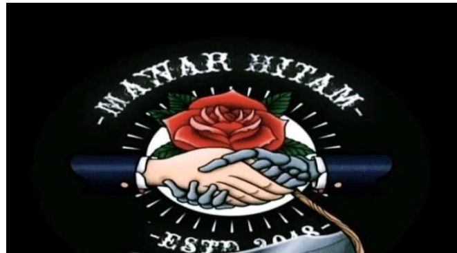
Gambar 4.1 Logo Komunitas Mawar Hitam

Mawar hitam merupakan komunitas anak remaja tongkrongan yang dibentuk sejak 25 maret 2018, awal mula terbentuknya mawar hitam timbul akibat banyak gangster bermunculan dan meresahkan masyarakat, sehingga terbentuklah komunitas Mawar hitam untuk melawan gangster-gangster tersebut. Mawar hitam beranggotakan lebih dari 50 orang terdiri dari laki-laki perempuan yang berusia 16-23 tahun. Mawar hitam memiliki Instagram untuk mengupload semua kegiatan mereka dengan ID Username: MawarHitam214. Logo Mawar hitam memiliki arti berjabat tangan karna silaturahmi tidak boleh putus. Mawar hitam memiliki tujuan yaitu; penghancur kesombongan.